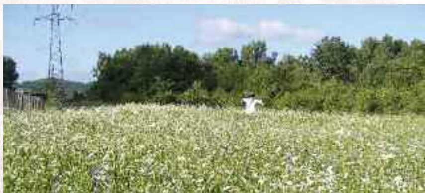
Culture à gibier - Photo Vincent LAMPASONA