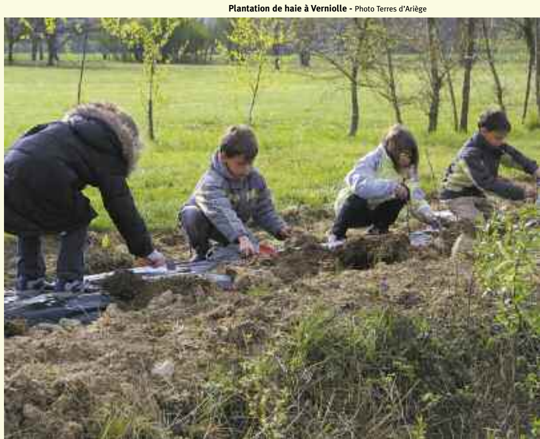
Plantation de haie à Verniolle

Il tient compte des conditions locales et privilégie les essences régionales. Afin d'optimiser l'intérêt des haies pour la faune sauvage, des séquences longues sont choisies, permettant d'implanter jusqu'à douze essences différentes, les arbustes fructifères étant largement représentés. La plantation aléatoire de chaque essence donne un aspect naturel, mais il