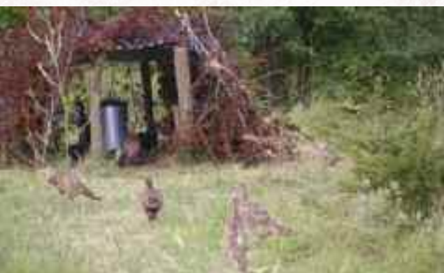
Mangeoires - Photo Vincent LAMPASONA