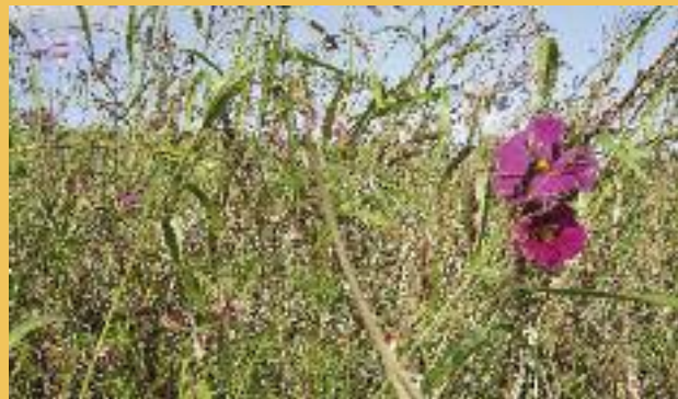
Jachère fleurie.

LES VERGERS DE PLEIN VENT sont en fait des prairies sur lesquelles ont été maintenus quelques arbres fruitiers le plus souvent pâturées après la récolte des fruits. En hiver, c'était l'endroit où l'on trouvait les volées de grives litornes. C'est aussi un site privilégié pour la reproduction d'un petit rapace nocturne autrefois commun : la chevêche d'Athéna. Les fruits au sol attirent petit et grand gibiers à une saison où la nourriture devient rare.