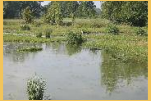
Réseau de mares à Mazères