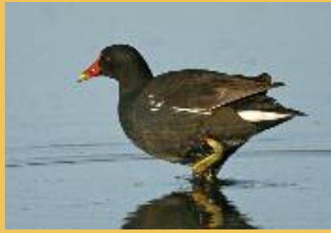
Gallinule poule d'eau, une simple mare, même isolée, permet sa présence.

L'eau est indispensable à la vie, c'est une évidence. Sa présence sur un territoire peut conditionner l'abondance et la répartition de nombreuses espèces sauvages. Elle peut prendre la forme d'une simple source ou d'une véritable mare de quelques dizaines de mètres carrés, mais nécessitera toujours un minimum d'entretien pour ne pas se combler. Beaucoup de ces petits points d'eau ont aujourd'hui disparu de nos territoires.