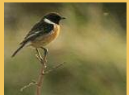
Un autre oiseau des bords de champ : le tarier pâtre.