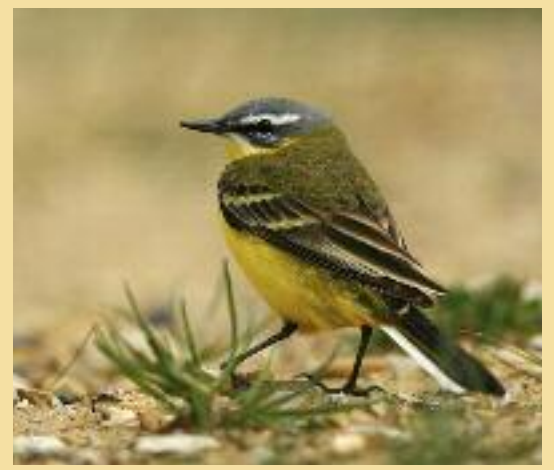
Bergeronnette printanière

LES JACHÈRES ENVIRONNEMENT FAUNE SAUVAGE en contrat « adapté » sont de véritables cultures dont la récolte est exclusivement réservée à la faune sauvage. En place jusqu'à la fin de l'hiver, elles fournissent une nourriture abondante durant la période la plus difficile. Sur celles qui font l'objet d'un contrat "classique" le broyage est interdit entre le 1 er mai et le 31 août.