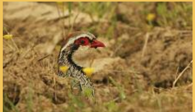
Perdrix rouge

LES DÉPENDANCES VERTES sont loin de se limiter aux seuls espaces agricoles. Les bords de route sont tout aussi favorables à la reproduction des nicheurs terrestres. Les nids de perdrix rouges, régulièrement découverts sur les bords des petites routes de campagne, en témoignent.