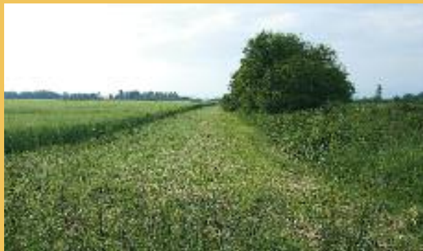
Bande enherbée broyée début juin, en plaine d'Ariège. C'est une opération à éviter en pleine période d'incubation de l'avifaune, notamment de la perdrix rouge.

LES BANDES ENHERBÉES sont une réelle opportunité pour des espèces comme la perdrix rouge, le faisan commun et la caille des blés. C'est en effet un espace linéaire suffisamment large avec un couvert herbacé favorable à l'installation de leurs nids. Il correspond tout à fait à la périphérie des bords de parcelles de céréales, de prairies ou de jachères utilisées habituellement par ces oiseaux.