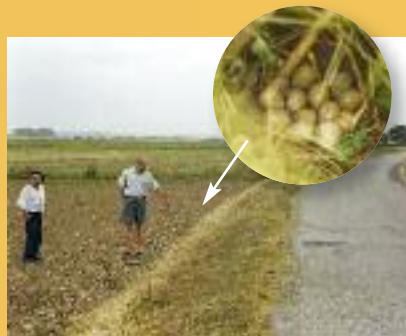
Nid de perdrix rouge dans le talus d'une route, Basse Vallée de l'Ariège.

LES DÉPENDANCES VERTES sont loin de se limiter aux seuls espaces agricoles. Les bords de route sont tout aussi favorables à la reproduction des nicheurs terrestres. Les nids de perdrix rouges, régulièrement découverts sur les bords des petites routes de campagne, en témoignent.