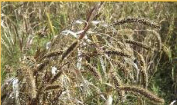
Moha de Hongrie utilisé en mélange dans nos jachères faune sauvage

LES JACHÈRES ENVIRONNEMENT FAUNE SAUVAGE en contrat « adapté » sont de véritables cultures dont la récolte est exclusivement réservée à la faune sauvage. En place jusqu'à la fin de l'hiver, elles fournissent une nourriture abondante durant la période la plus difficile. Sur celles qui font l'objet d'un contrat "classique" le broyage est interdit entre le 1 er mai et le 31 août.