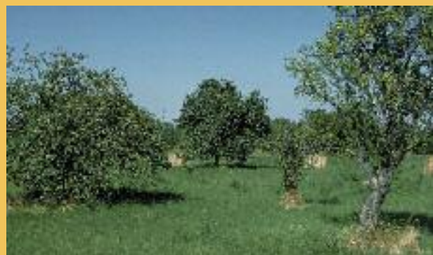
Verger de plein vent à Rieux de Pelleport.

LES VERGERS DE PLEIN VENT sont en fait des prairies sur lesquelles ont été maintenus quelques arbres fruitiers le plus souvent pâturées après la récolte des fruits. En hiver, c'était l'endroit où l'on trouvait les volées de grives litornes. C'est aussi un site privilégié pour la reproduction d'un petit rapace nocturne autrefois commun : la chevêche d'Athéna. Les fruits au sol attirent petit et grand gibiers à une saison où la nourriture devient rare.