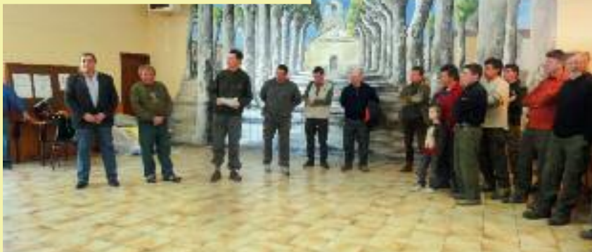
Le Président, les organisateurs, les juges et les concurrents

4 mars sur le territoire de l'Arize : ÉPREUVE DE CHASSE LOCALE SUR LIÈVRE organisé par le GIC de l'Arize.