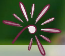
Cardamine des prés