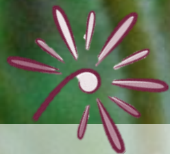
Anémone pulsatille tardive