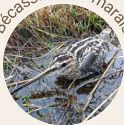
Bécassine des marais

Parties dégagées avec une végétation basse , qui n'excède pas les 15 cm.