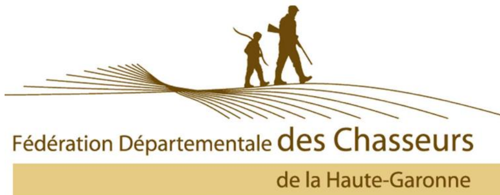
Schéma Départemental de Gestion Cynégétique 2020-2026